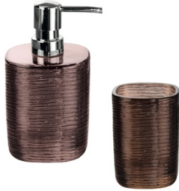
ACCESSOIRE-SERIE QUBO: Glas, Rouge & Nussbraun, ab 17,99 €

Blickfang der neuen Themenwelt sind der Badteppich „Dream“ sowie die Accessoire-Serie „Qubo“. Ein weiteres Highlight ist die Kollektion „Bow“ mit gepunktetem Duschvorhang und Accessoires in filigranem Liniendesign. Neue unifarbene Artikel runden die Designwelt COZY BROWN harmonisch ab.