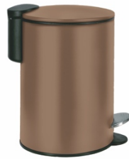
KOSMETIKEIMER SILENCE: 3L, Metall, Kaschmir, 24,99 €