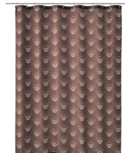
DUSCHVORHANG BOW: 180 x 200 cm, 100% Polyester, Nussbraun, 34,99 €