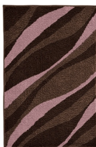
BADTEPPICH DREAM: versch. Maße, 100% Polyester, Nussbraun, ab 52,99 €

Die Farbe Braun erlebt aktuell ein Comeback und zählt als satte Kontrastfarbe zu den Interieur-Trends 2023. Mit der neuen Designwelt COZY BROWN gibt Kleine Wolke schon heute eine Preview auf die Ambiente 2023 . Dort präsentiert das Bremer Unternehmen diese und weitere Kollektion „live & in Farbe“. In COZY BROWN vereinen sich beruhigende Erdtöne mit gedecktem Rouge. Große Bögen, filigrane Punkte und runde Formen setzen gekonnt Akzente im wohlig-warmen Badezimmer.