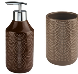
ACCESSOIRE-SERIE BOW: Steinzeug, Nussbraun & Cappuccino, ab 12,99 €

Die Kollektion „Cozy Brown“ ist ab sofort auf www.kleinelwolke.com und im Fachhandel erhältlich.