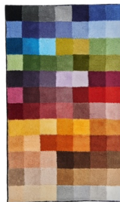
BADTEPPICH CUBETTO: 85x145 cm, 100% Polyacryl, Multicolor, ab 259,99 €