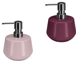
SEIFENSPENDER COOPER: Steinzeug, Altrosa & Vino, je ab 13,99 €

Analoge Farben miteinander zu kombinieren, ist die einfachste Möglichkeit, den Trend COLOR BLOCKING umzusetzen. So finden Farben zusammen, die im Farbzirkel eng beieinander liegen, wie z.B. Braun und Grün, Blau und Lila sowie Gelb und Orange. Das Ergebnis: ein harmonisches, homogenes Gesamtbild, welches gleichzeitig starke Kontraste setzt.