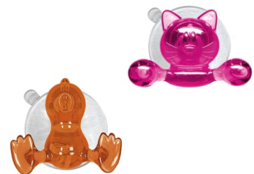
SAUGHAKEN BABY BIRD & KITTY KATE: Polystyrol, Orange & Pink, je ab 7,49 €