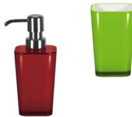
ACCESSOIRES EASY: Seifenspender & Zahnputzbecher, Kunststoff, Mohnrot & Grün, ab 7,99 €