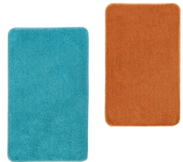
BADTEPPICH RELAX: 60x100 cm, 100% Polyacryl, Türkis & Rost, ab 59,99€

Die bunten Bad-Textilien und Accessoires sowie viele weitere farbenfrohe Hingucker sind auf www.klenewolke.com und im Fachhandel erhältlich.