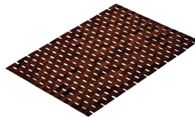
FUSSMATTE PALITO: 50x70 cm, Bambus, Nussbraun, 34,99 €