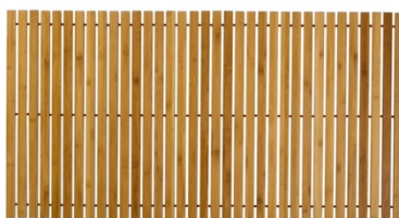
FUSSMATTE LEVEL: 60x115 cm, Bambus, Natur, 99,99 €