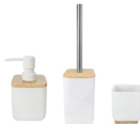
ACCESSOIRES CROSSOVER: Seifenspender, WC-Bürste, Zahnputzbecher, Polyresin / Bambus, Weiß, ab 14,99€