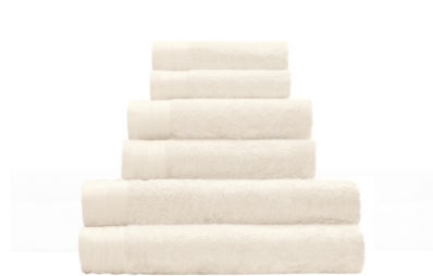
FROTTIERWARE BAO: Waschhandschuh, Gäste-, Hand-, Duschtuch, Bambusfaser, Beige, von 5,49 € bis 36,99 €

Bambus gibt's auch in flauschig-weich? Aber hallo: Wer Kleine Wolke kennt, weiß, dass der Bereich Textilien zu den Kernkompetenzen des Unternehmens gehört. So liegt es geradezu auf der Hand, dass nun auch die ganz neue Frottierware BAO aus diesem nachhaltigen Naturmaterial zum Sortiment des Bremer Badspezialisten gehört. Die Dusch-, Hand- und Gästetücher zeichnen sich besonders durch ihre weiche Haptik, hohe Saugfähigkeit und Langlebigkeit aus und sind in neutralem Beige, Weiß, Blau, Flieder oder Grün erhältlich.